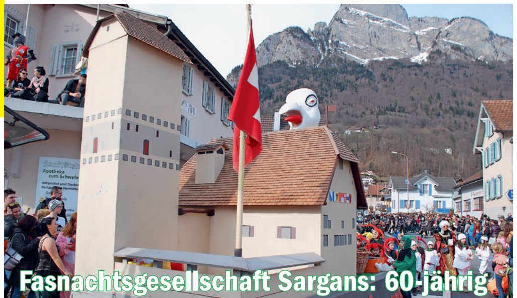
Fasnachtsgesellschaft Sargans: 60-jährig