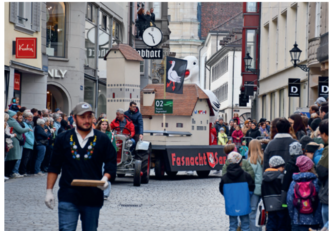
Die Fasnachtsgesellschaft Sargans ist regional wie kantonal bestens bekannt.

Viel Aufmerksamkeit schenkt die FG den Kindern, die sind schliesslich die Zukunft der Sarganser Fasnacht. Auf dass den Sargansern die Fasnachtsfeiberigen nicht ausgehen! (sg)