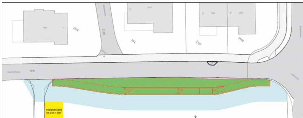
Planauszug: Geplante Bushaltestelle; Kreuzung Bidemsstrasse /Kantonstrasse

Nach der Beurkundung des Kaufvertrages zur Sicherung des Landerwerbs kann nun das Projekt angegangen und die entsprechenden Bewilligungen auf kantonaler Ebene eingeholt werden. Die Realisierung ist vorbehältlich allfälliger Einsprachen im Sommer 2023 vorgesehen. Der Gemeinderat ist davon überzeugt, dass mit der Errichtung dieser neuen Bushaltestelle ein weiterer wichtiger Beitrag zum Ausbau der Erschliessung der Quartiere geleistet werden kann. Weitere Verbesserungen der Erschliessung folgen im Rahmen der in der Nutzungsstrategie «Bad Ragaz mobil» verabschiedeten Zielsetzungen.