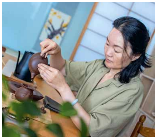
Volle Konzentration: Die traditionell chinesische Teezubereitung erfordert die volle Aufmerksamkeit der Teemeisterin.