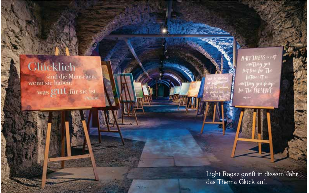
Light Ragaz greift in diesem Jahr das Thema Glück auf.

Light Ragaz ist zurück in der Taminaschlucht – ab sofort bis Mitte Oktober. Die Besucher erwartet nebst einer spektakulären Naturkulisse ein inspirierendes Storytelling. Die Geschichte rund ums Thema Glück stammt aus der Feder von Light Ragaz, für die künstlerische Umsetzung beauftragt wurde zum ersten Mal das Kollektiv «Packungsbeilage».