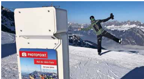
MyClimate Photopoint auf dem Hochplateau bei der Pizolhütte

Am Rossignol Speedcheck auf der Piste Zanuz testet man seine Grenzen auf einer speziell abgesicherten Piste aus. Am MyClimate Photopoint bei der Pizolhütte und bei der Fotofalle auf dem MounTeens-Schlittelweg kann man um die Wette lächeln und seine Erinnerungen mit nach Hause nehmen. Der BRACK.CH Skimovie auf dem Vreni Schneider Run (Riesenslalom) garantiert ein einzigartiges Rennerlebnis, indem man vom Start bis zum Ziel gefilmt wird und auch die dazugehörige Zeitmessung erhält. Teilnehmer*innen können über die App oder Webbrowser mit ihrem Skipass sowohl die Fotos, Videos als auch ihre Bestzeiten abrufen und via