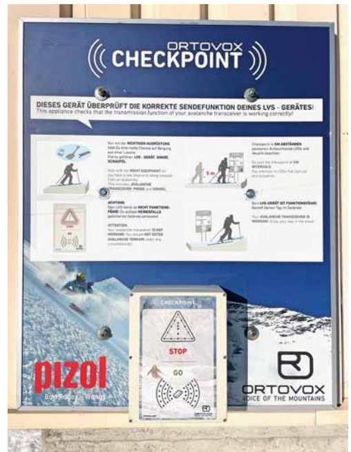
LVS-Checkpoint an der Bergstation Pizolhütte

Geht es nach dem positiven Studium des Lawinbulletins von SLF ( www.slf.ch ) in den freien Skiraum, kann man an der Pizolhütte sein LVS-Suchgerät auf die Funktionalität prüfen. Ein entsprechender Checkpoint ist an der Bergstation der Sesselbahn Gaffia-Pizolhütte angebracht. Bepackt mit wichtigen Informationen, einem voll ausgestatteten Equipment und hat man darüber hinaus den Einsatz des LVS-Gerätes praktiziert und getestet, steht einem herrlichen Tag abseits der organisierten Pisten nichts mehr im Wege.