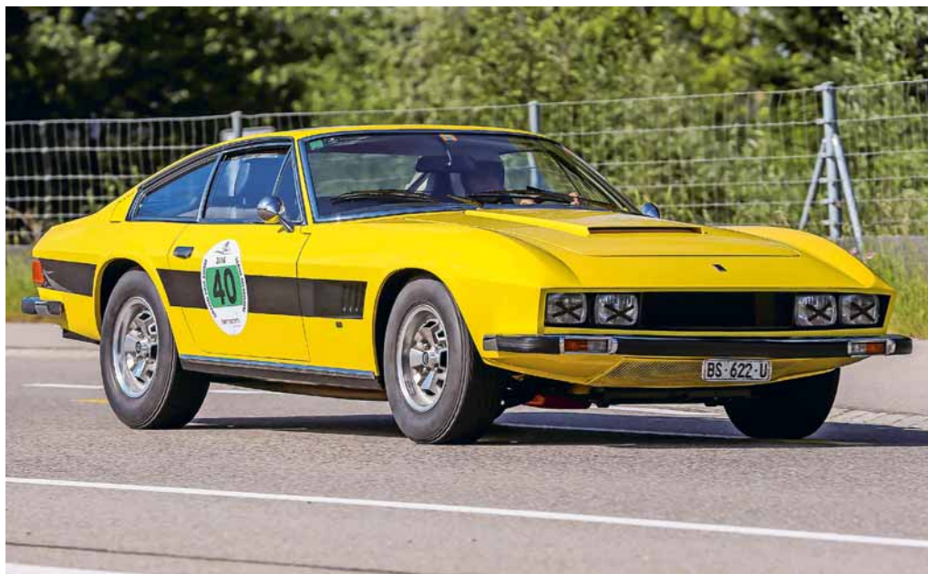
Der Monteverdi Berlinetta aus dem Jahr 1972 ist Teil der Ausstellung im Grand Resort Bad Ragaz.