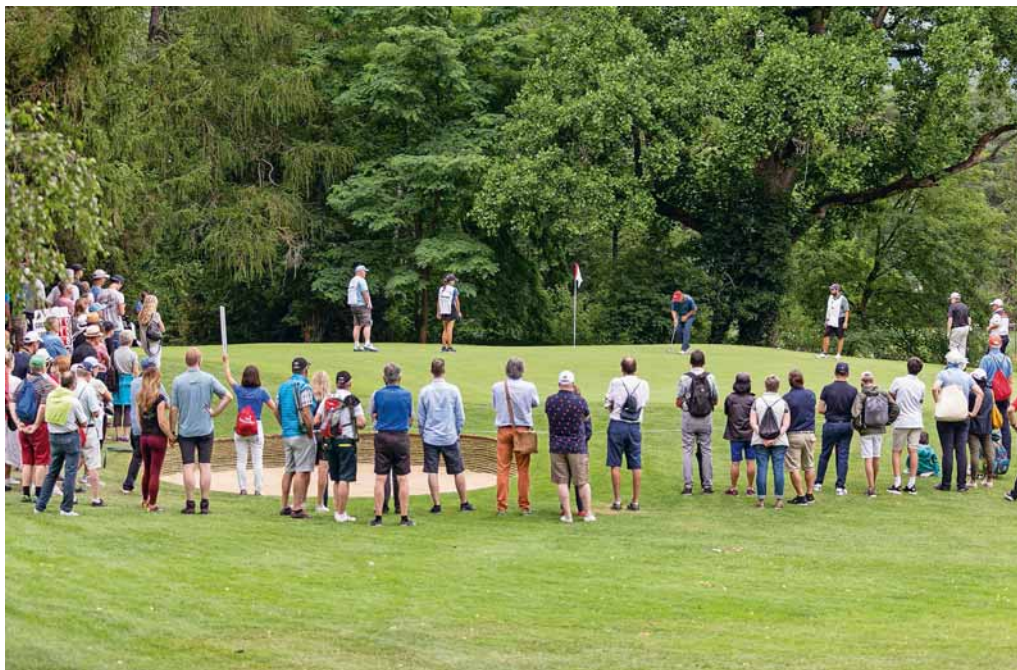
Hautnah dabei, wenn Weltklasse-Golfer nach dem Kristallpokal greifen: José Coceres (mit rotem Cap) auf dem Weg zum Swiss-Seniors-Open-Champion 2019. Der Argentinier wird vom 8. bis 10. Juli 2022 seinen Titel in Bad Ragaz verteidigen.